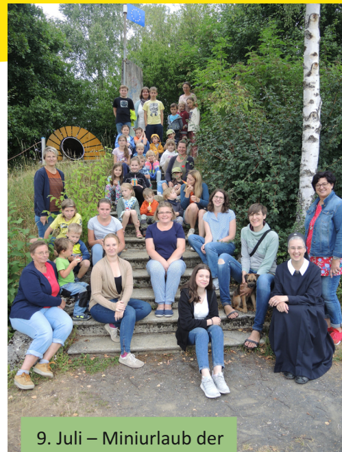
9. Juli – Miniurlaub der Frauen & Mütter