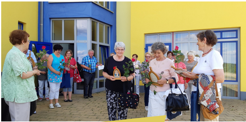
12. September Pilgerkreistreffen