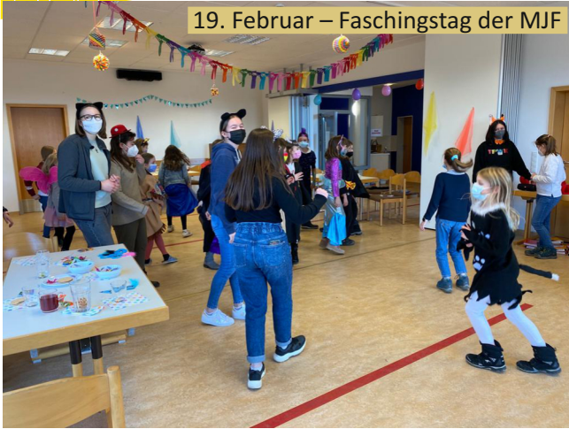
19. Februar – Faschingstag der MJF