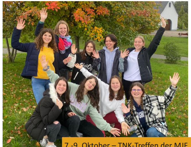
7.-9. Oktober – TNK-Treffen der MJF