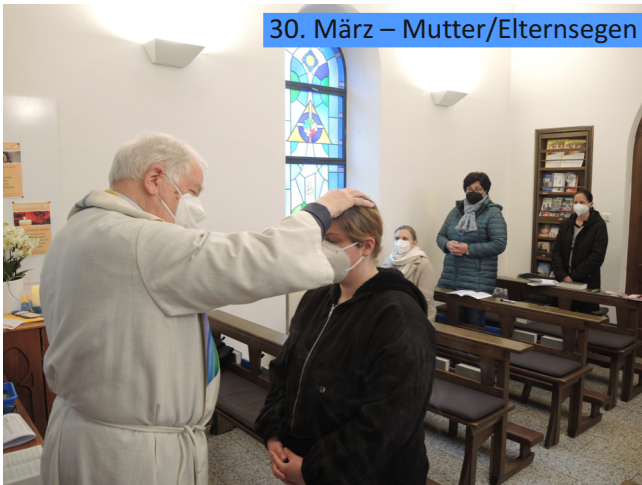
30. März – Mutter/Elternsegnen