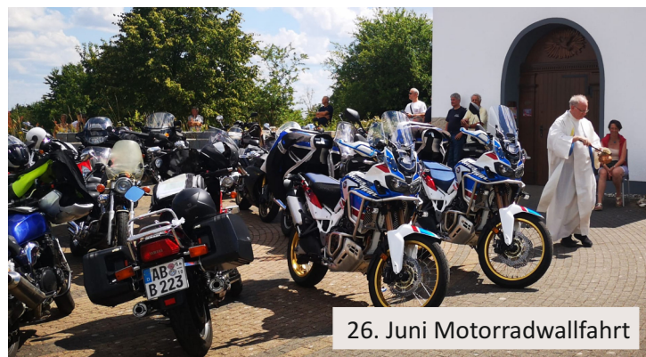
26. Juni Motorradwallfahrt