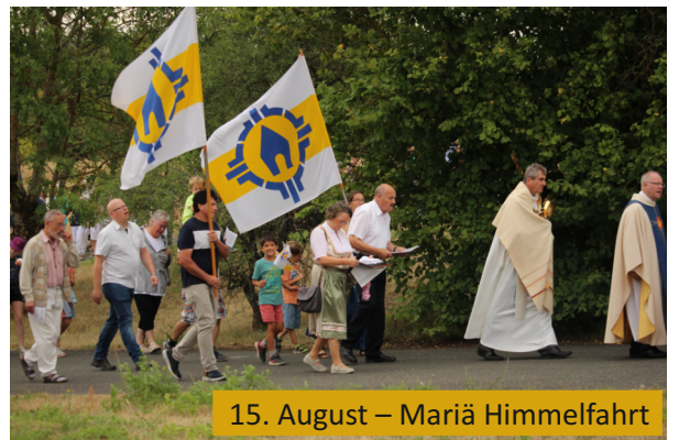
15. August – Mariä Himmelfahrt