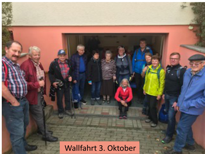
Wallfahrt 3. Oktober