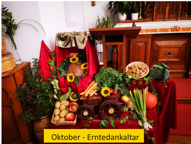
Oktober - Erntedankaltar