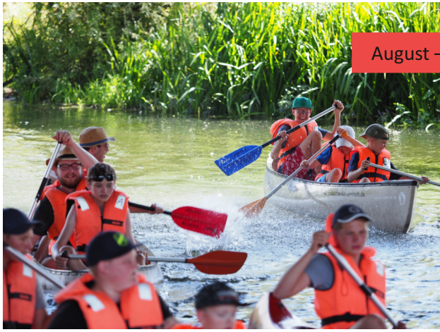
August – Zeltlager der SMJ