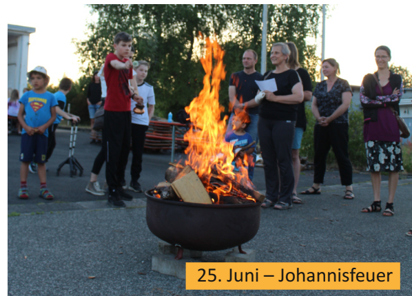
25. Juni – Johannisfeuer