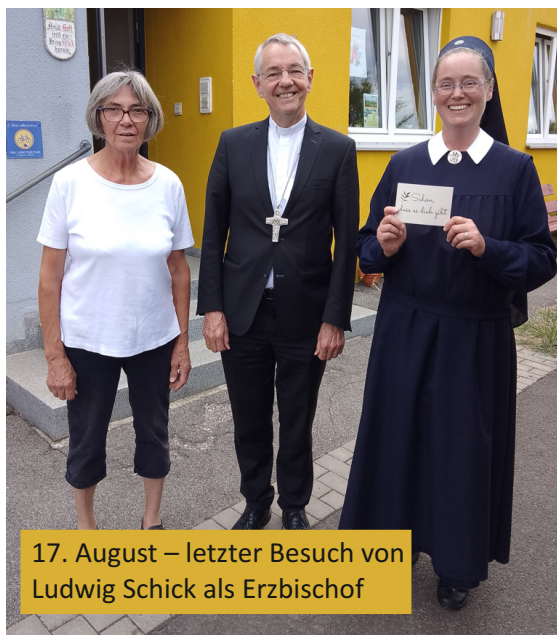
17. August – letzter Besuch von Ludwig Schick als Erzbischof