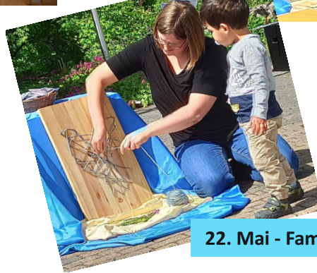
22. Mai - Familienandacht