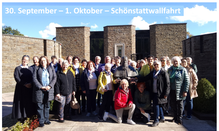
30. September – 1. Oktober – Schönstattwallfahrt