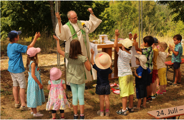
24. Juli – Familiensonntag Plus